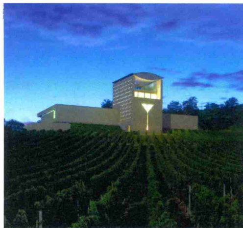
Weinkeller von Mario Botta bei Nacht.